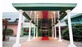
Ny entré på Hotell Liseberg Heden.