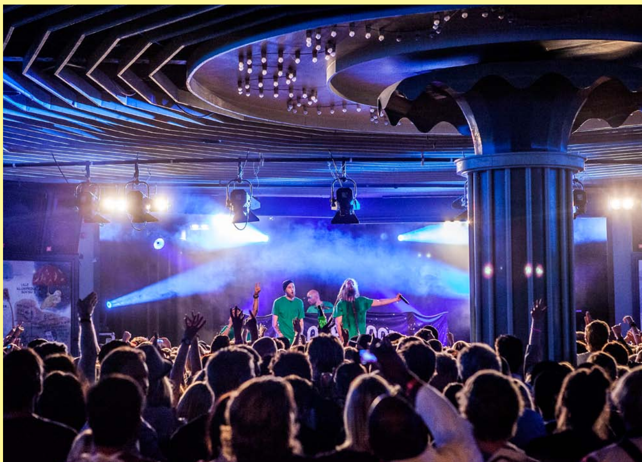
Stay out West på Polketten.