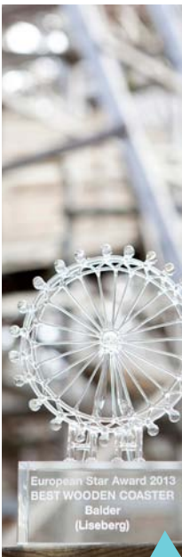
European Star Award 2013 BEST WOODEN COASTER Balder (Liseberg)